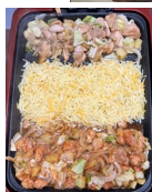
←チーズダッカルビ